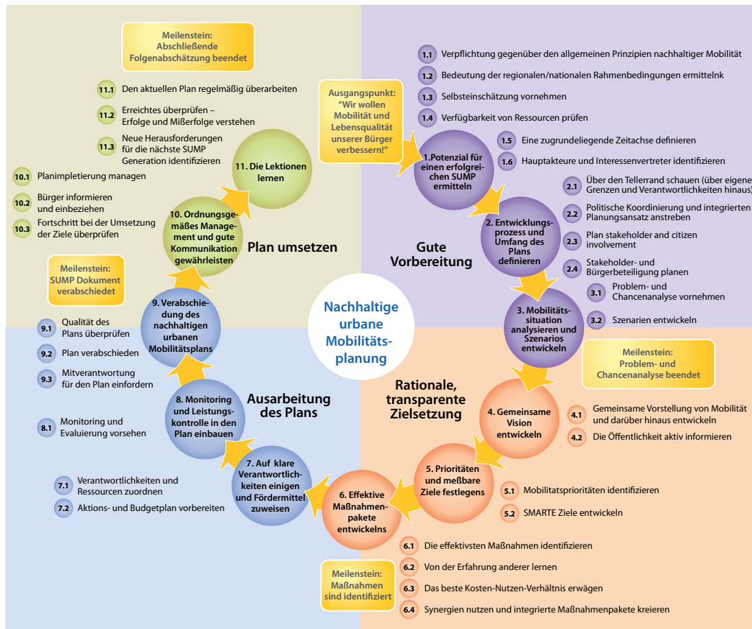
Abbildung 2: Strategic Urban Mobility Plans (SUMP)