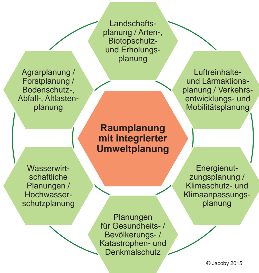
Abbildung 1: Umweltplanung(en) zur Integration in die Raumplanung